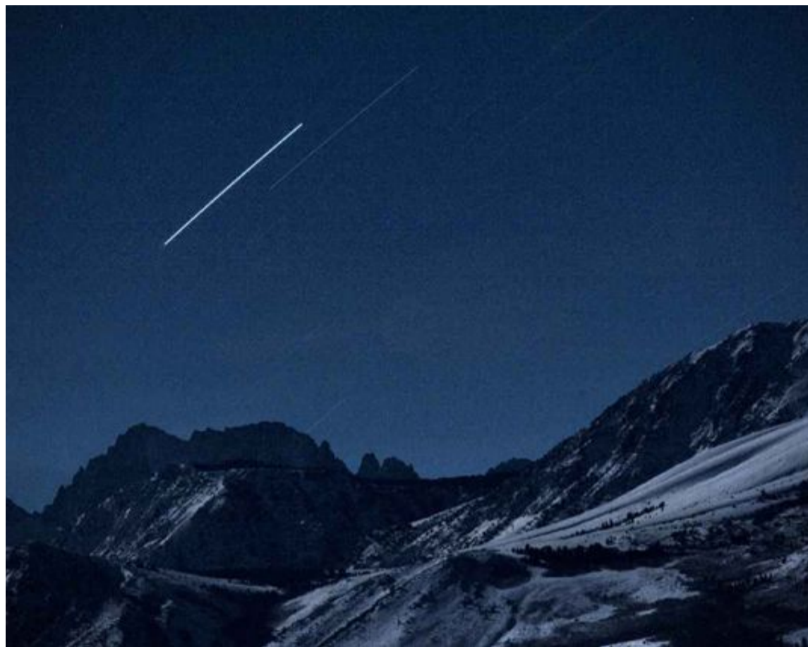
TREVOR PAGLEN: Fra utstillingen «The Other Night Sky» i Kunsthall Oslo.